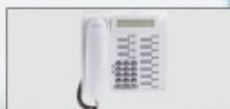
optiPoint 500 Standard