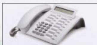
optiPoint 500 Basic