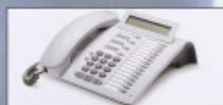
optiPoint 500 Advanced