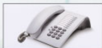
optiPoint 500 Entry

duplex, interface USB básica, confortáveis e com design moderno.