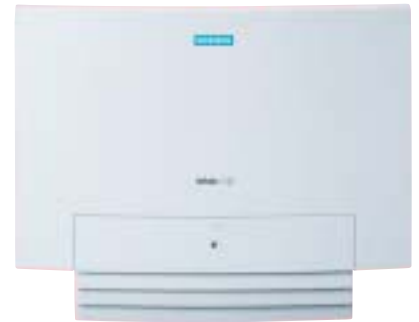
HiPath 1120: Equipamento ideal para pequenos escritórios e residências.