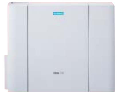
HiPath 1150: Disponibiliza uma grande variedade de facilidades para assessorar a sua empresa, minimizando custos e otimizando os processos do seu negócio.

de Call Center que permite ao supervisor receber e monitorar todas as informações sobre o atendimento. Evitando a perda de ligações, você ganha a fidelidade de seus clientes, além de otimizar os recursos necessários para o atendimento. O sistema informa os dados dos agentes, chamadas recebidas, fila de espera, estatísticas de atendimento por grupo e por agente, entre outras informações que auxiliam no gerenciamento do Call Center.